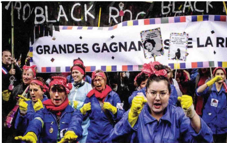
Page réalisée par Aziliz Claquin et Alice Le Dréau